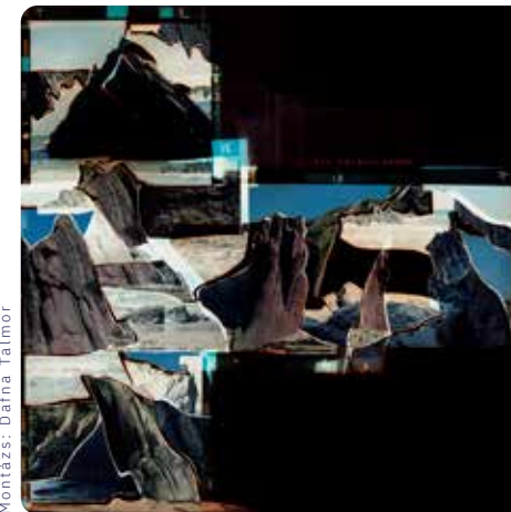
Montázs: Dafna Talmor

A belépőjegyes tárlat megtekinthető: 2023. augusztus 27-ig