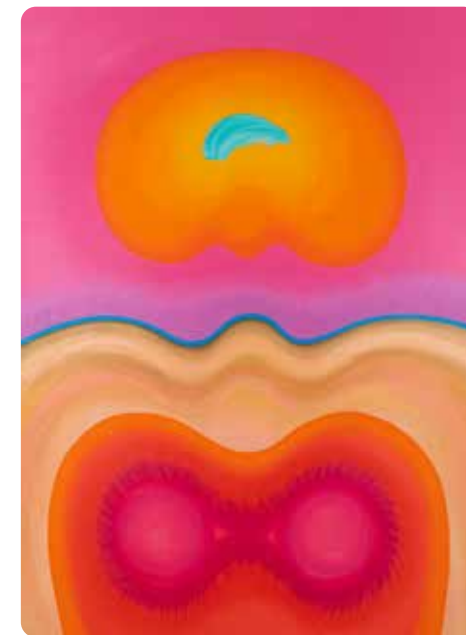
Keserü Ilona: Narancs-rózsá közelítés