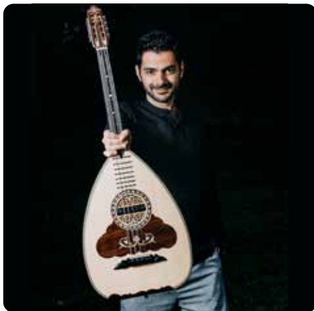
Fotó: Apostolos Grinias