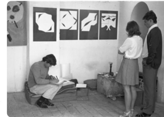
Kápolnaműterem, Balatonboglár, 1970

időszakban a kápolnaműterem olyan alkotók találkozási pontjává vált, akik sem korábban, sem később nem találtak közös nevezőt?