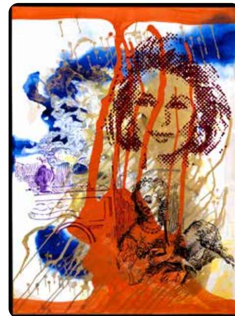
Sigmar Polke alkotása

Polkét a hatvanas évek óta foglalkoztatta a valóság, a mindennapi élet és a művészet viszonya. Ebben távolságtartó, ironikus álláspontot vett fel, amely lehetővé tette számára, hogy a tartalmi kérdésen túl a festészet formájára és anyagi természetére is figyelmet fordítson.