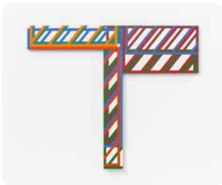
Maurer Dóra műve

Maurer Dóra a magyarországi neoavantgárd kiemelkedő alkotója. Művészete, pedagógiai és határokat átívelő művészetközvetítő tevékenysége mind a hazai, mind pedig a nemzetközi szintér meghatározó alakjává tette. A balatonfüredi Vaszary Galéria korai grafikai munkáiból, konceptuális fotóműveiből, filmjeiből és festményeiből mutat be sokrétű válogatást.