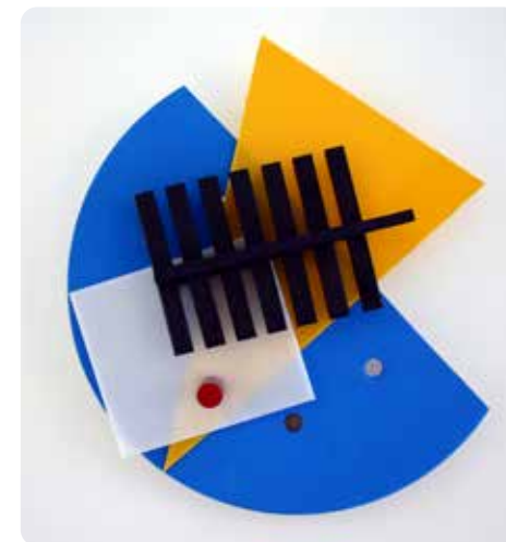
Ézsiás István: Madi relief