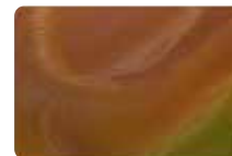
Bernát András: Objektum No. 437.